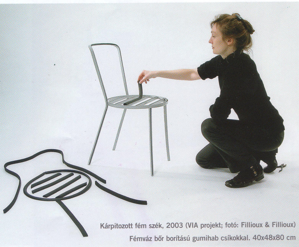
Kárpitozott fém szék, 2003 (VIA projekt)

Fémváz bőr borítású gumihab csíkokkal. 40x48x80 cm